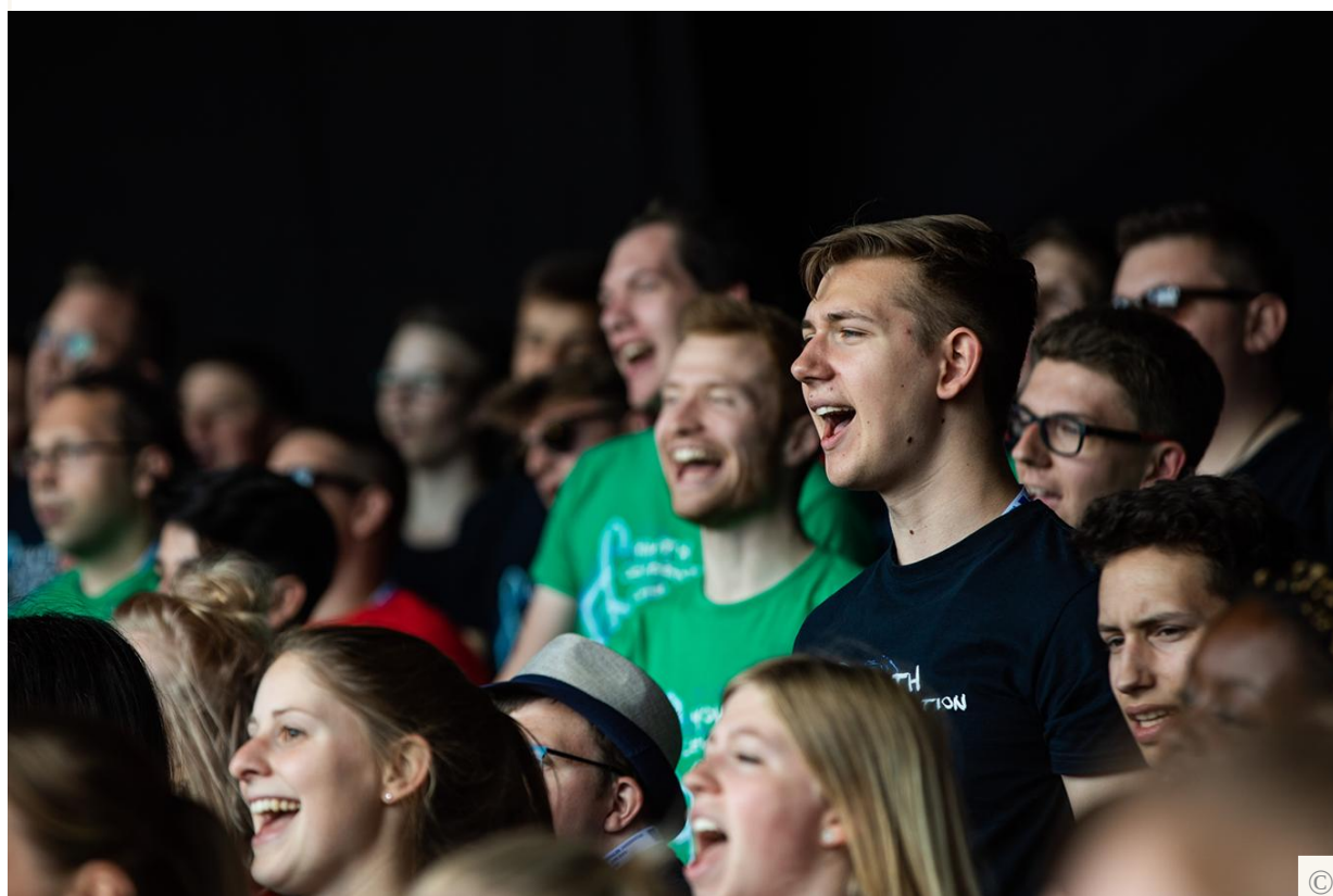
Mitglieder des Youth Celebration Choir auf dem Internationalen Jugendtag 2019 in Düsseldorf.